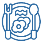
Потребление основных продуктов питания населением на душу населения в год; килограммов; яйца - штук